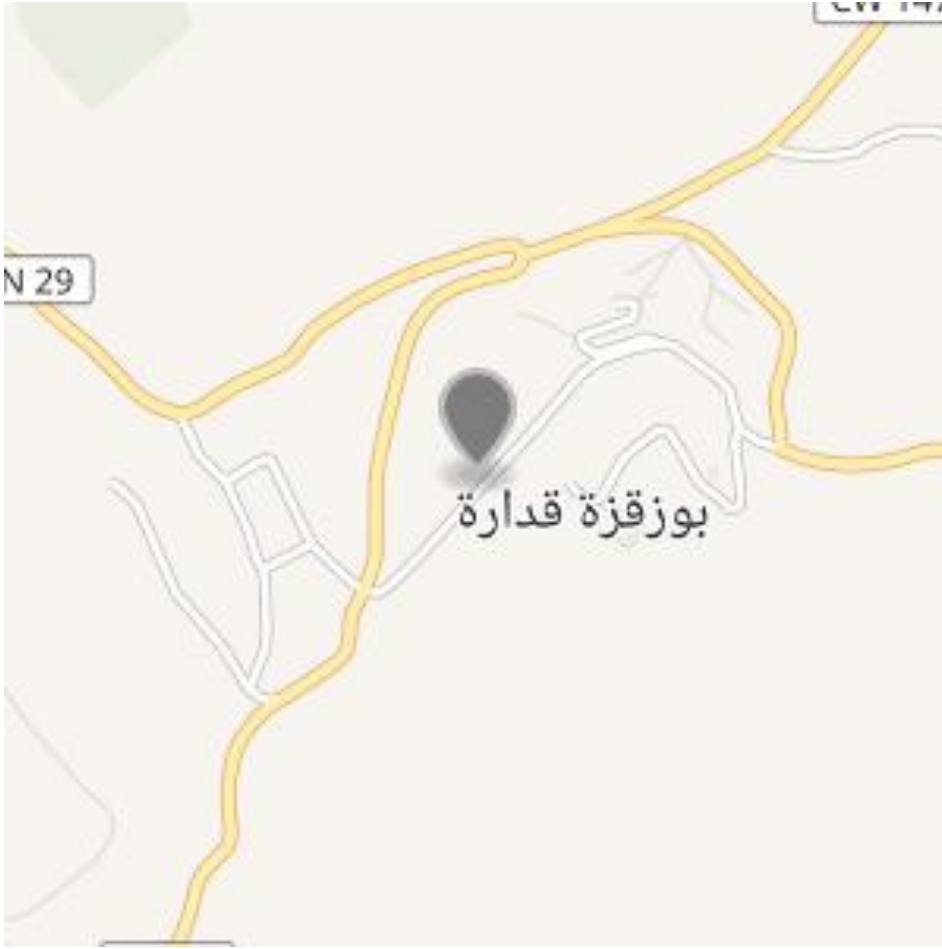
خريطة بومرداس، بلدية