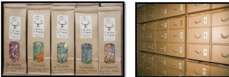
Figure 1.5 : La conservation des plantes dans un papier carton

Les plantes médicinales sont conservées dans des récipients légers, aériens et secs en porcelaine, en terre cuite ou en verre coloré, des boîtes en fer blanc sèches, des sacs en papier ou des caisses. Cette technique est nécessaire pour les plantes qui subissent une transformation chimique sous l'influence de la lumière ultraviolette. Les plantes riches en produits volatils et s'oxydant rapidement sont stockées en milieu fermé (Djeddi, 2012 ; Delille L, 2007).