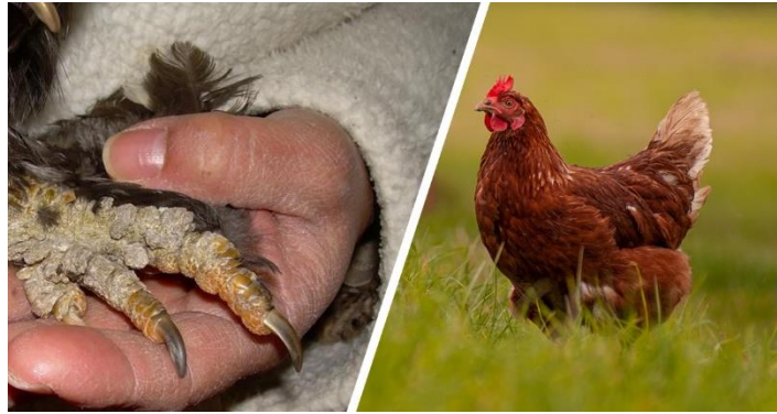
Figure 2.7 : maladie gale de poule

Chez la poule, on distingue deux sortes de gale, toutes les deux causées par un parasite externe : la gale déplumante et la gale des pattes . Dans le premier cas, l'acarien se loge au niveau du plumage de la volaille et lui fait perdre ses plumes, souvent dans le cou ou sur le dos. Pour la seconde pathologie, l'acarien se trouve sous les écailles des pattes, provoquant leur décollement et leur déformation.