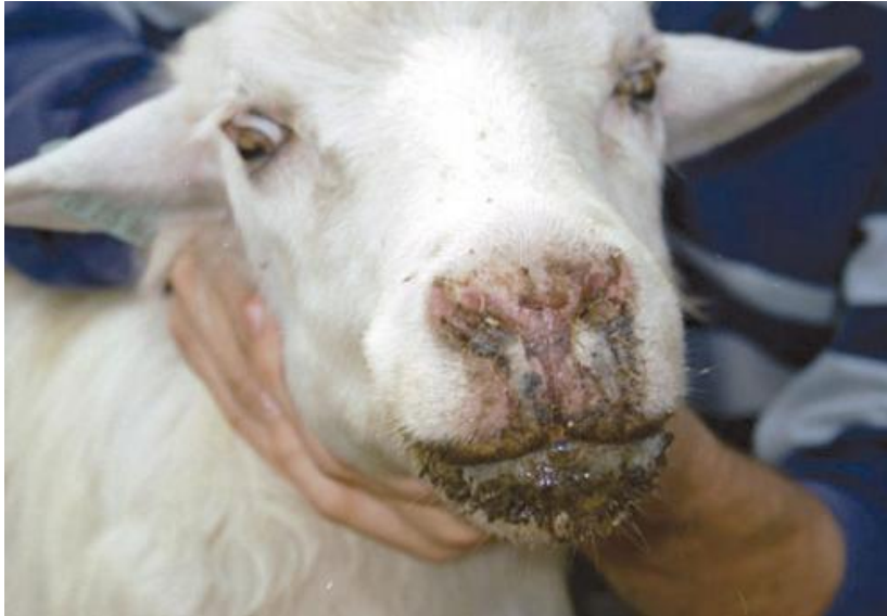
Figure2.15 : la maladie de la fièvre catarrhale du mouton

La langue bleue et gonflée, caractéristique de cette maladie dont le nom est par ailleurs tiré, ne se manifeste pas systématiquement. Il n'existe aucun médicament contre ce virus. Le traitement vise à réduire la douleur et à prévenir les infections bactériennes. N'exposez pas les moutons à la lumière du soleil et donnez-leur une alimentation facile à digérer et de l'eau potable.