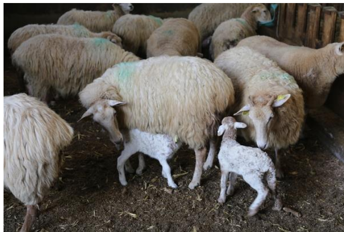
Figure 2.17 : Chlamydophila abortus

est une bactérie qui provoque la naissance anticipée du fœtus. Cette maladie est transmissible à l'homme. C'est la raison pour laquelle les femmes enceintes doivent de préférence éviter les moutons.