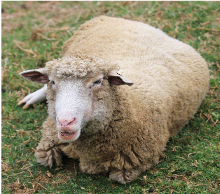
Figure 2.20 : le typhus sporadiques

est dû à une carence en magnésium. Il entraîne une diminution de l'appétit et une rigidité au niveau de la démarche. Conseil : réduisez le stress dans les troupeaux lié au typhus sporadique.