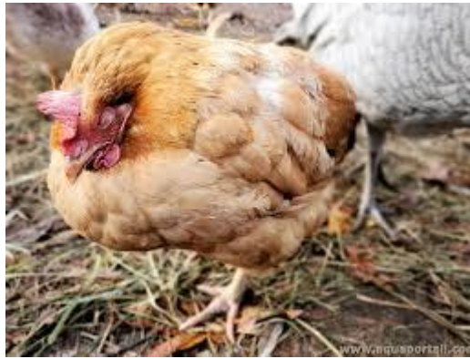
Figure 2.4 : Coccidiose

Enfin, une santé générale dégradée ou une météo douce et humide peuvent impacter l'état intestinal des poules et déclencher une coccidiose. Elle se transmet ensuite d'une poule à une autre, généralement par les fientes.