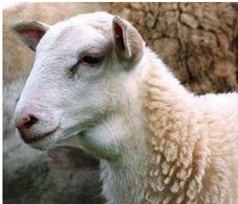
Figure 2.18: La lymphadénite caséuse

est une inflammation des ganglions lymphatiques également appelée maladie des abcès. Elle est transmissible à l'homme. Cette maladie est incurable, mais pas mortelle. Les abcès percés constituent une importante source de contamination.