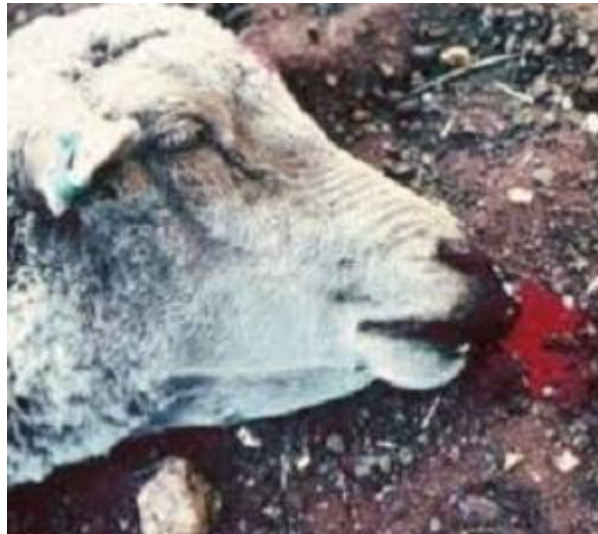
Figure 2.14 : maladie de Fièvre du charbon

Il s'agit d'une maladie causée par le bacille de la fièvre charbonneuse, Bacillus anthracis , qui est l'un des plus gros bacilles non mobiles connus et se présente sous forme de chaînes courtes positives pour la coloration de Gram. Ces bacilles ont la capacité de former une capsule. La maladie est répandue en Asie, en Afrique, en Europe et en Amérique. Chez les animaux, le tube digestif est la principale voie d'infection lors de la consommation d'aliments ou d'eau contaminée. L'infection peut également se produire par inhalation, par blessures et par piqûres d'insectes. Les moutons, les chèvres, les vaches et les chevaux sont très sensibles à l'infection, tandis que les chiens et les porcs sont infectés lorsqu'ils mangent de la viande provenant d'animaux morts de la maladie ou des aliments contaminés. Les oiseaux et les autruches sont également sensibles à l'infection. Concernant les symptômes, certains animaux meurent dans l'étable ou dans les pâturages sans symptômes significatifs, mais les symptômes observés sont une irritation sévère, de l'anxiété, un arrêt de la rumination et un gonflement du cou, de la poitrine et du bas-ventre. Le traitement est effectué à l'aide d'antisérum. Les grands animaux reçoivent entre 100 et 300 ml par voie intraveineuse et les petits animaux reçoivent entre 50 et 200 ml d'antibiotiques tels que la pénicilline et l'auréomapsine.