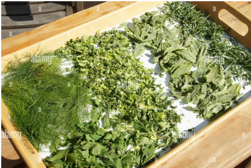
Figure 1.3 : technique de séchage des plantes médicale

Cette technique de séchage se fait généralement sur un grand linge propre et blanc posé sur le sol de 11 h à 16 h (maximum 17 heures) avant la venue de l'humidité du soir. (Anonyme, 2018).