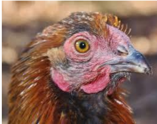
Figure2.5 Maladie de Marek

Pathologie transmissible et mortelle , les poules se contaminent facilement entre elles, simplement par inhalation.