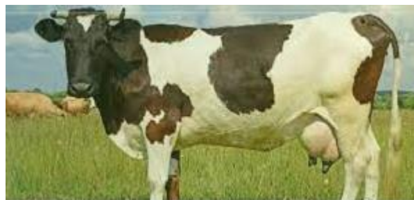
Figure 2.13 : maladie de mammite de vache

Elle est également connue sous le nom de mammite et il s'agit d'une maladie courante chez les mammifères producteurs de produits laitiers tels que les vaches, les moutons et les chèvres. Elle est due au stress, aux blessures physiques et aux bactéries. Tout cela conduit à une mammite de la vache, où des bactéries ou d'autres micro-organismes tels que des champignons ou des virus envahissent la vache. L'infection commence au moment où la bactérie pénètre dans le canal du trayon, puis se multiplie dans la glande mammaire, conduisant à une mammite. la maladie à traiter, l'agent pathogène doit être identifié. Si l'infection est bactérienne, elle est traitée en donnant des antibiotiques à la vache infectée, mais si l'infection est fongique, elle est traitée en prenant des antifongiques et elle guérit complètement.