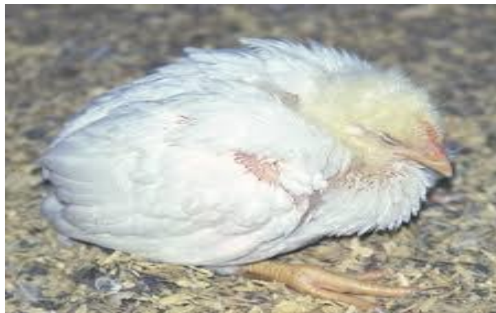
Figure 2.2. : Maladie de Gumboro

Très contagieuse, la bursite infectieuse est également particulièrement résistante et difficile à éliminer dans les élevages infectés.