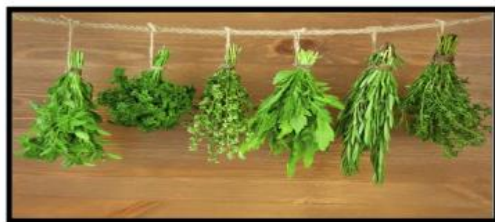
Figure 1.2. : Séchage de la plante a tige.

Cette méthode traditionnelle n'est pas forcément la plus efficace. Ces fameux bouquets destinés à faire des tisanes deviennent souvent un élément de décoration. (Anonyme, 2018).