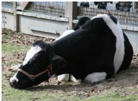
Figure 2.10 :la maladie de la vache folle

La crise de la vache folle, apparue dans les années 1990, a provoqué l'effondrement du marché de la viande bovine en raison de l'anxiété des consommateurs suite à la propagation d'une épidémie d'encéphalite spongiforme bovine, dite maladie de la vache folle, qui touche les élevages européens depuis 1986 et est soupçonnée d'être transmise à l'homme, ce qui constitue une alternative à la maladie de Creutzfeldt - Jacob.