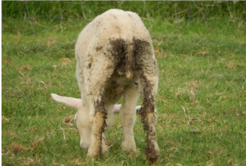
Figure 2.19 : la coccidiose

est provoquée par des micro-organismes unicellulaires qui attaquent la paroi intestinale et provoquent ainsi des hémorragies internes. Les animaux s'affaiblissent et maigrissent.