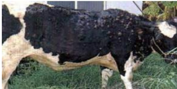
Figure2.11 : la maladie de dermatite digitale

L'oxytétracycline topique est souvent indiquée comme traitement le plus fiable. Le contrôle et la prévention de cette maladie dépendent d'une détection, d'un isolement et d'un isolement rapides. traitement des vaches affectées. Les bains de pieds au sulfate de cuivre sont l'une des formes de protection et de traitement les plus courantes contre la dermatite digitale grâce à leurs propriétés antimicrobiennes et à leur capacité à durcir les sabots pour éviter l'exposition aux bactéries. Le cuivre est un moyen de prévention plus efficace. plutôt qu'un traitement pour cette maladie.