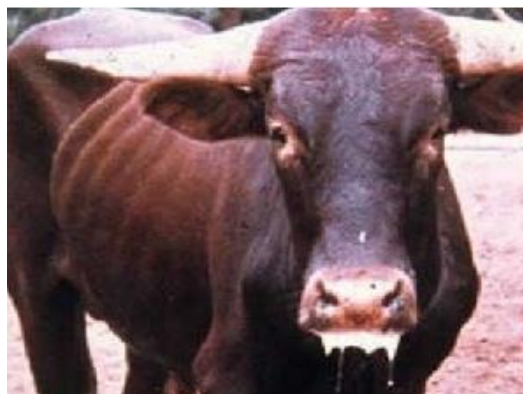
Figure 2.9 : Fièvre aphteuse

Ce virus est très variable génétiquement, ce qui limite l'efficacité de la vaccination, et les humains ne sont pas infectés par le virus responsable de la fièvre aphteuse.