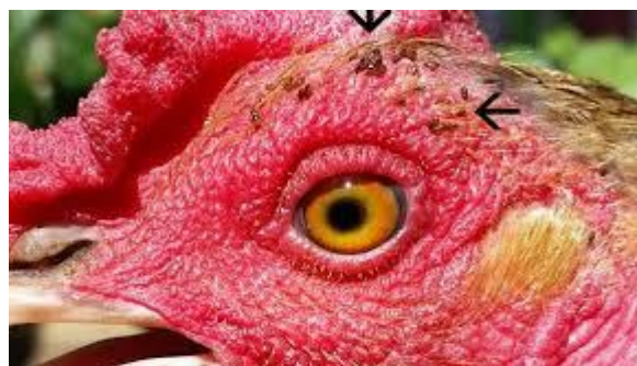
Figure 2.8: les poux rouge

Cet acarien hématophage se nourrit du sang des volailles, provoquant une anémie, du stress ainsi qu'un affaiblissement général. À l'instar des puces, il est particulièrement actif durant les mois les plus chauds de l'année.