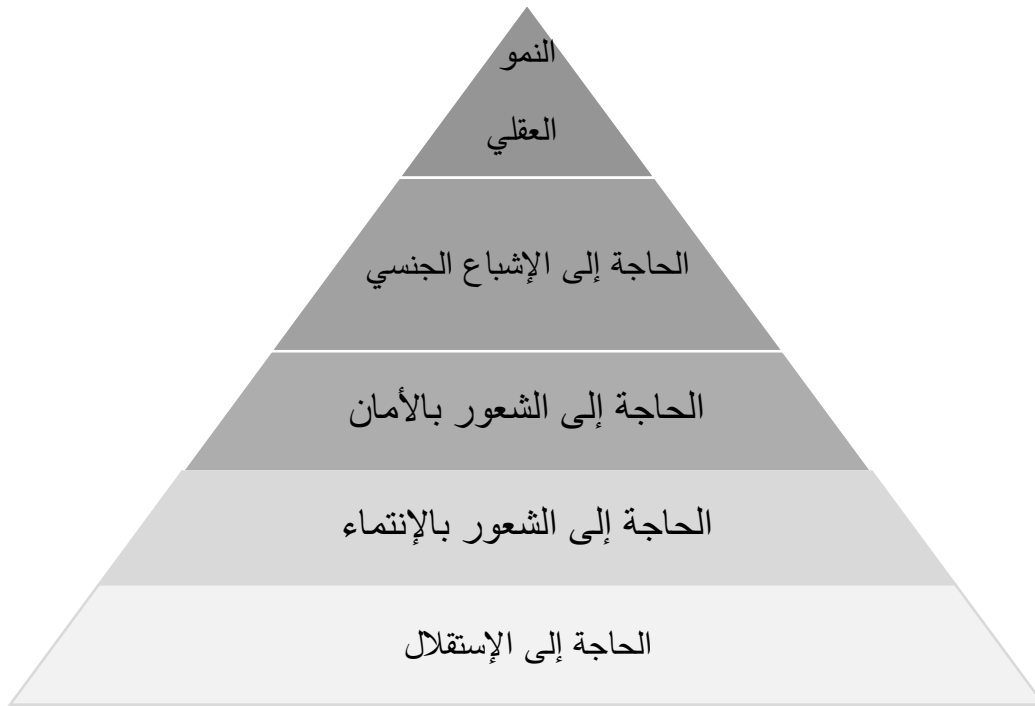
الشكل رقم (02): حاجات المراهقة

أشار إليها رفاعي (2014) بأنها تتضمن الحاجة إلى التفكير وتوسيع قاعدة الفكر والسلوك، وإلى تحصيل الحقائق وتفسيرها وكذلك إلى الخبرات الجديدة والتنوع وإشباع الذات عن طريق العمل والتقدم الدراسي ونمو القدرات والنجاح.