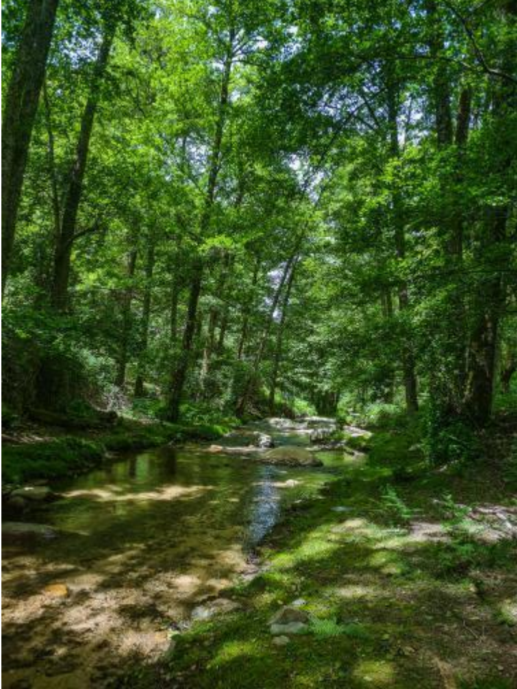
ملحق رقم 02: لقطة قريبة